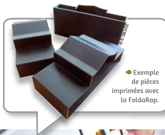
◀ Exemple de pièces imprimées avec la FoldaRap.