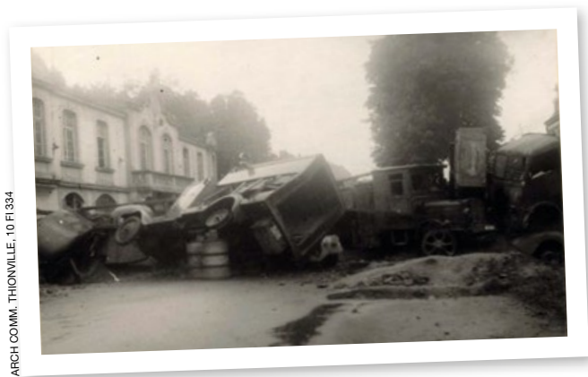
ARCH COMM. THIONVILLE, 10 FI 334

◆ Barricades constituées par les défenseurs allemands sur l'avenue Albert I er à Thionville, septembre 1944.