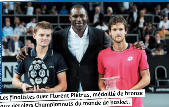
Les finalistes avec Florent Piétrus, médaillé de bronze aux derniers Championnats du monde de basket.