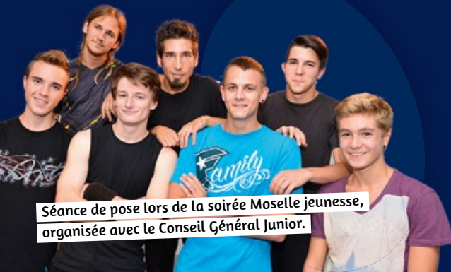
Séance de pose lors de la soirée Moselle jeunesse, organisée avec le Conseil Général Junior.