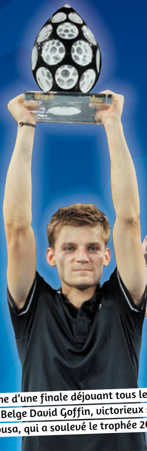
Au terme d'une finale déjouant tous les pronostics, c'est le Belge David Goffin, victorieux sur le Portugais Joao Sousa, qui a soulevé le trophée 2014.