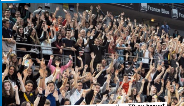
Tous les collégiens ayant obtenu la mention TB au brevet des collèges 2014 avaient été invités par le Conseil Général.